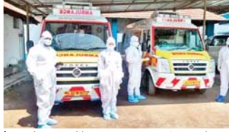
लॉकडाउन की अवधि में 2200 से ज्यादा संक्रमित मरीजों को