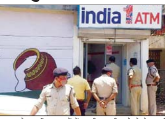
अधिकारी द्वारा भी घटना की पुष्टि हुई।

दुर्ग। जिले में कोरोना की रोकथाम को लेकर प्रभावी लॉकडाउन को चोरों ने बड़ा अवसर बना लिया है।