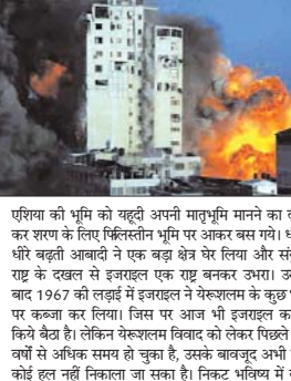
इजरायल के हमले में फिलिस्तीन के शहर गाजा में करीब 50 लोगों की मौतें हुई हैं। इसमें मरने वालों में मासूम बच्चे और महिलाएँ शामिल हैं। इसके अलावा 300 से ज्यादा लोगों के घायल होने की खबरें भी सामने आ रही हैं।

के लिए प्रथम विश्व युद्ध और द्वितीय विश्व युद्ध के बीच के समय में जाना होगा, तो पाएंगे कि यूरोपीय देशों में अफसरी संघर्ष चल रहा था। ऐसे में यहूदियों ने यूरोप छोड़ेन? का निर्णय लिया। आज यहूदी शरण को लेकर अरमसंघ में युद्ध भी चल रहा है। तब यहूदियों को एक फेलो सूझी। इस बीच पश्चिमी