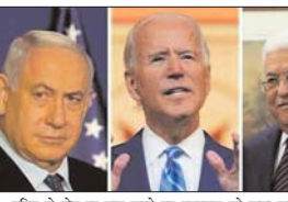
पूतिन से जैन पर बात करते हुए इजरायल को कड़ प्रभक सिखाके की प्रतिबद्धता जाहिर की है ताकि फिलिस्तीनी को उसकी जमीन वापस दिलाई जा सके। अक्सर किसी की नजर में तुर्की की यह प्रतिबद्धता एस-400 मिसाइल सिस्टम को लेकर है, जिसे वह वेस्ट बैंक में स्थाित कर इस्रायल को डराना चाहता है, और इसी कड़ी में एरदोने ने पूतिन से अनुमति मांगने के लिए उन्हें कॉल किया था। हालांकि, तुर्की सिमिन्दिखावा कर रहा है क्योंकि वह सऊदी अरब को स्ट्राइक खुद मुस्लिम ब्रदर्स का लीडर बनाना चाहता है और यद्यपि एरदोने पूरती येरूशालम के शेख जुबैद जमीन मामले में रूढ़ को अंतिम समापना का खलौकी के तौर पर देश कर रहे हैं वस इस्तौलिय वह इतनी संख्य भाषा का इस्तेमाल कर रहे हैं, वरना जब पूर्ण पमाने पर युद्ध छिड़ जायेगा तो सबसे पहले भगाने वालों में यही देश आगे होया देखा जाये तो सबसे ज्यादा नुकसान सिर्फ आम नागरिकों की ही होया, पहले भी गाजा में रहने वाले कई नागरिकों ने हमला द्वारा रॉकेट लाँगिंग का विरोध किया लेकिन उनकी किसी ने नहीं सुनी। दरअसल दुनिया की सकारे बनती तो नागरिकों के हानि है, लेकिन तुर्की को ही नहीं सुनती। चूंकि अब जब परमाणु संघर्ष युद्ध में मिलिट्री इन्वेस्टमेंट कानून लागू कर सैन्य प्रशिक्षण को सुके अपने सभी आम नागरिकों को युद्ध के लिए तैयार रहने का पमान जारी करने के साथ भी भयकम डकें के द्वारा तीन तरफसे गाजा पट्टी को घेर लिया है। तब भी सबसे ज्यादा

अब के परिदृश्य में इस्रायल के साथ सिर्फ अमेरिका ही नहीं बल्कि फ्रंस और जर्मनी भी आ गए हैं, हेमनी तो तब हूँ जब ऑस्ट्रिया के चांसलर सेवेस्टियन कुर्ज ने अपने आधिकारिक कार्यालय की इमारत के ऊपर ऑस्ट्रिया, यूरोपियन युनिनन के समकक्ष इस्रायल का झंडा लगाकर समर्थन की प्रतिबद्धता जताई।