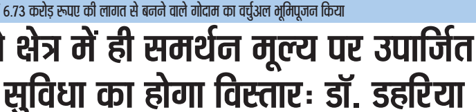
अतिरिक्त देना होता था। गोदाम के बनने से चालक के भण्डारण की सुविधा आरंग में ही उपलब्ध हो सकेगी। आरंग में वर्तमान वेयरहाउस की क्षमता 1800 मेट्रिक टन है। छत्तीसगढ़ स्टेट रिजर्विल सर्वाइज काफेसियन द्वारा अतिरिक्त 10 हजार 800 मेट्रिक टन क्षमता की आवश्यकता एवं 8 वर्ष की व्यवहारिक दौरा दी गई है।