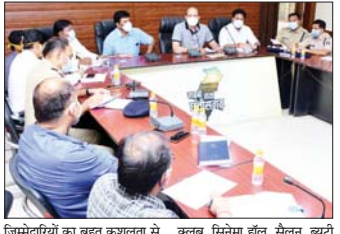
जिम्मेदारियों का बहुत कुशलता से निभाया गया है।